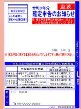
「確定申告のお知らせ」はがきイメージ