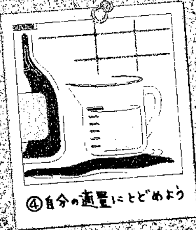
④自分の適量にとどめよう