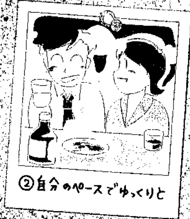
②自分のペースでゆくりと