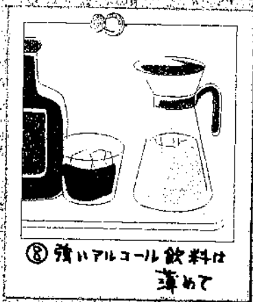
⑧強ハアルコール飲料は薄めて