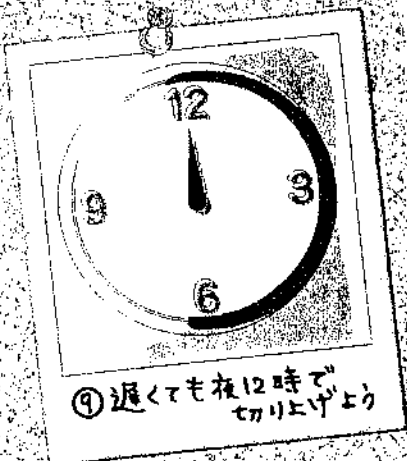
⑨遅くても夜12時まで切り上げよう