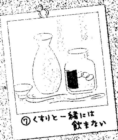
①くすりと一緒には飲まない