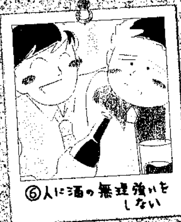
⑥人に酒の無理強いをしない