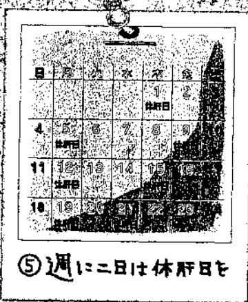
⑤週に二日は休肝日を