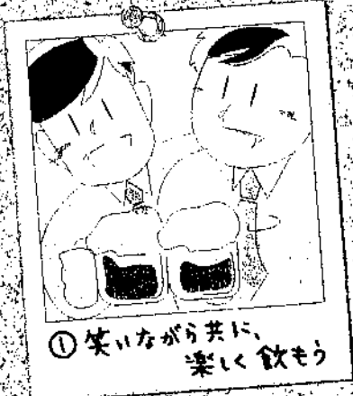
①笑いながら共に、楽しく飲もう