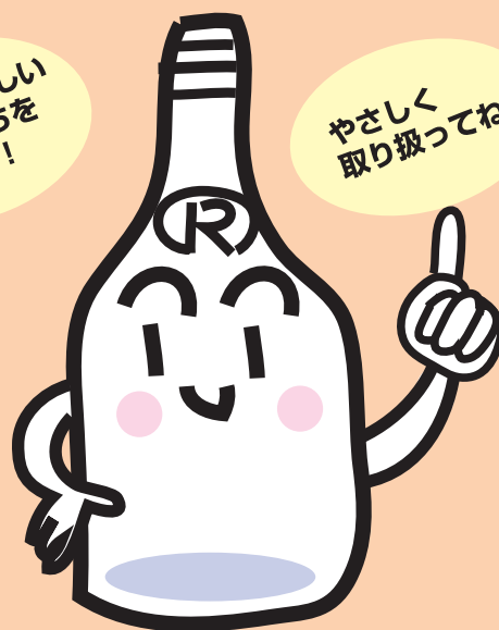
いっしょう 一升びんちゃん