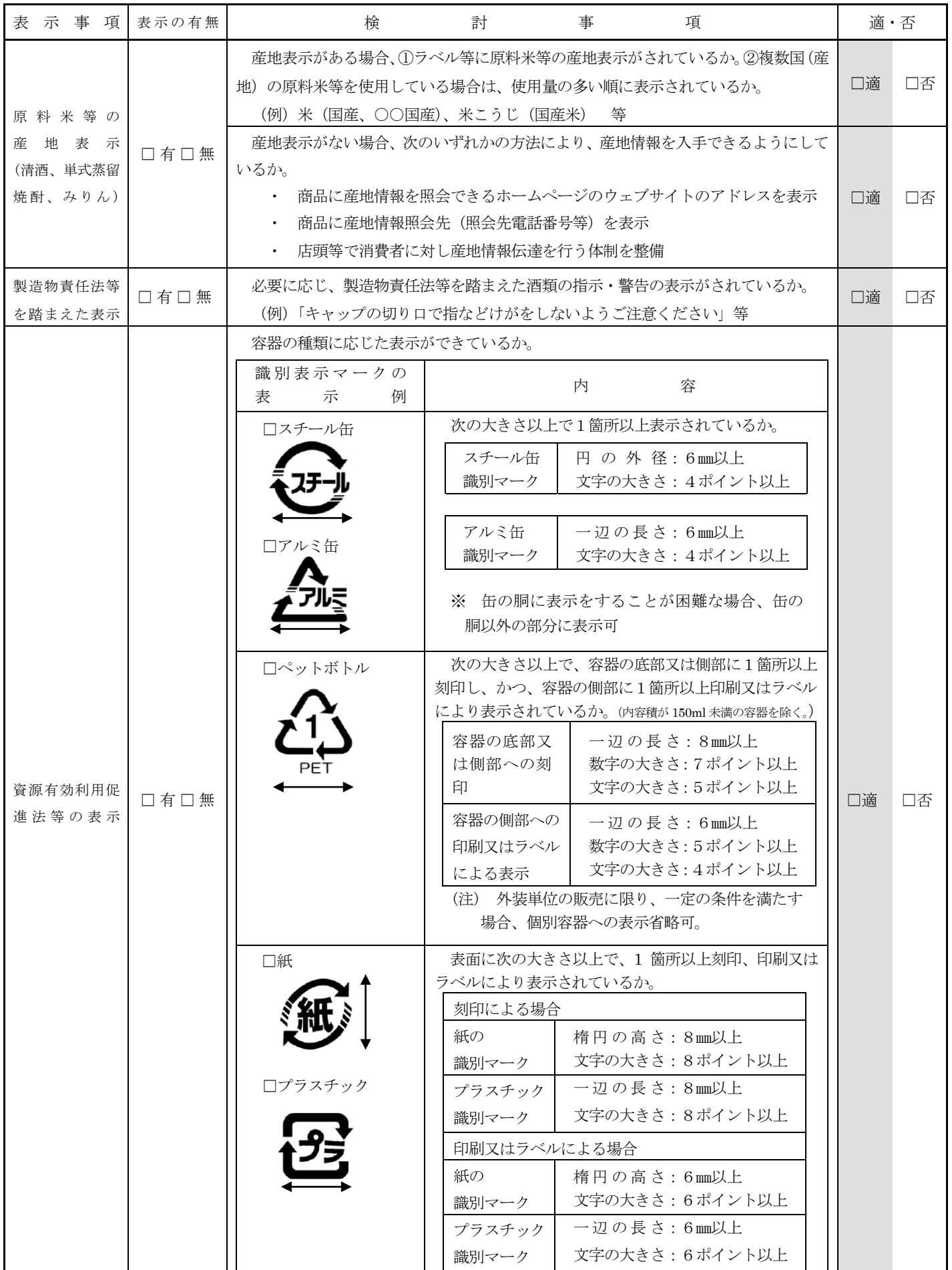
(R5.1)酒類の表示方法チェックシート(焼酎に関する表示事項用)