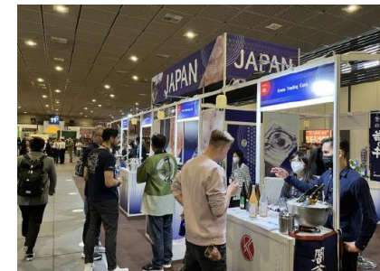
国税庁ブースの様子（2022年）