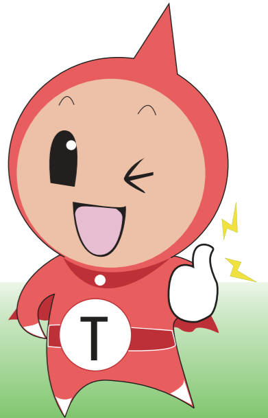
eLTAXイメージキャラクター: エルレンジャー