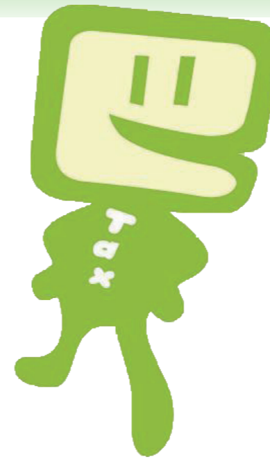
国税庁e-Taxキャラクター: イータ君