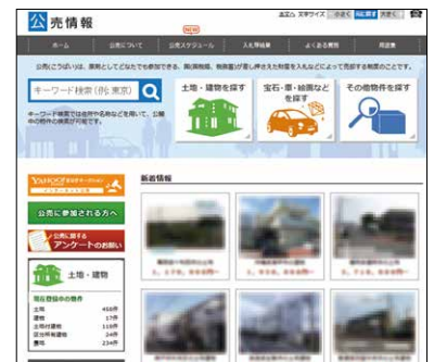
(国税庁ホームページ「公売情報」)