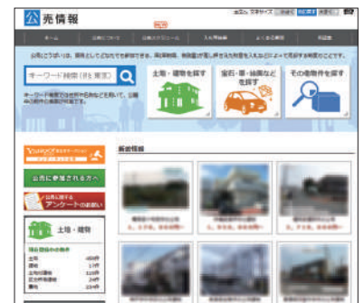
(国税庁ホームページ「公売情報」)