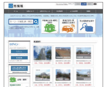
(国税庁ホームページ「公売情報」)