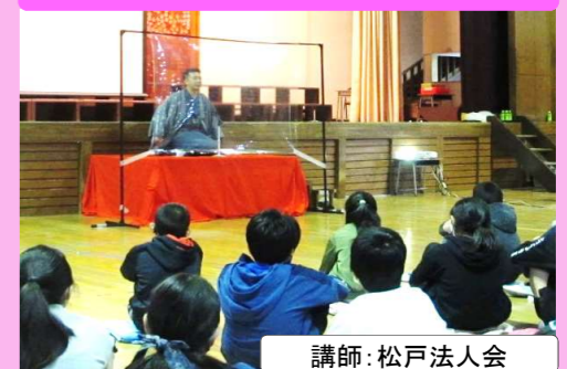
講師:松戸法人会 落語で楽しく税の学習!