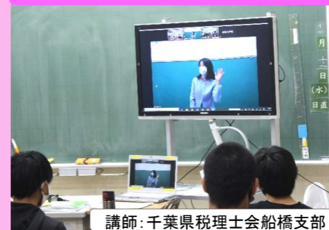
講師:千葉県税理士会船橋支部 コロナ禍でもリモート租税教室!