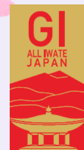
【オールいわて清酒】