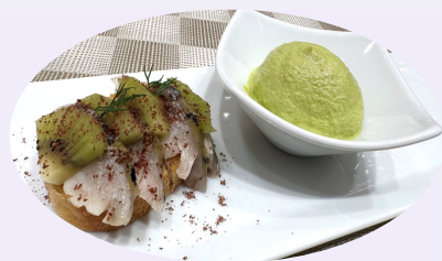
千葉 麻里絵 氏考案の試食料理