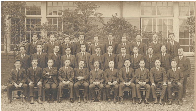
昭和4年 大藏省稅務講習會 修了証書(上)と記念写真(下)