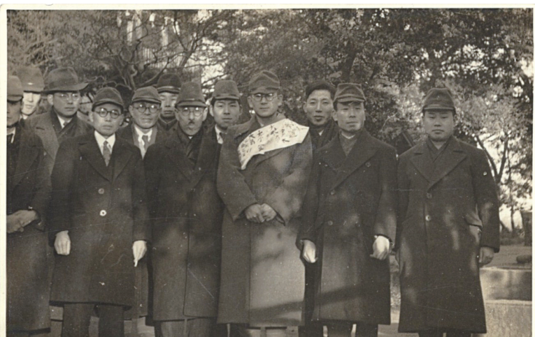
昭和10年代 出征する税務職員