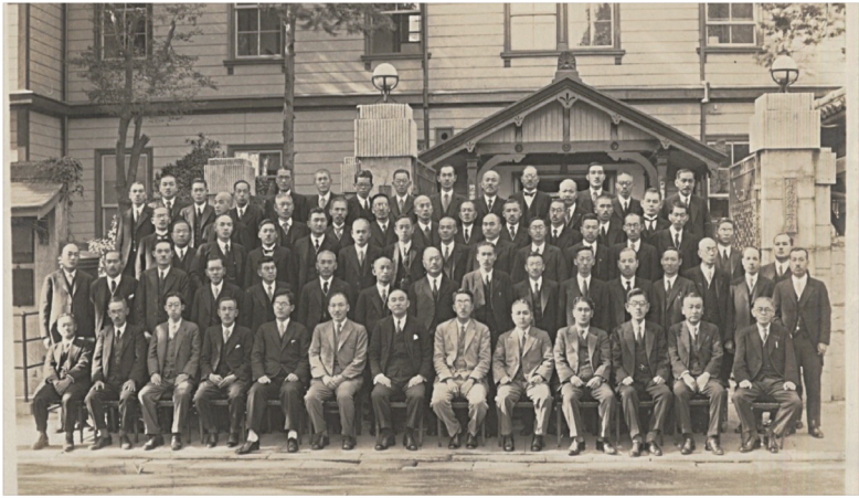
昭和8年 熊本税務監督局管内の税務署長会議記念写真