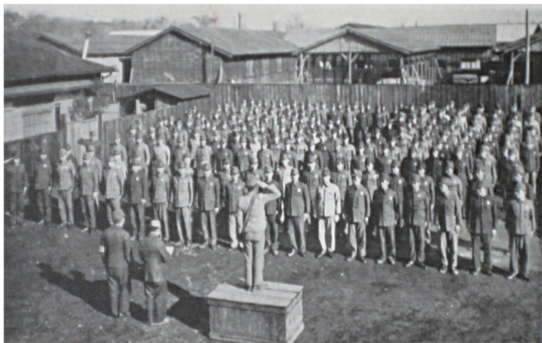
昭和 18 年 大蔵省税務講習所の寄宿生（朝の点呼）