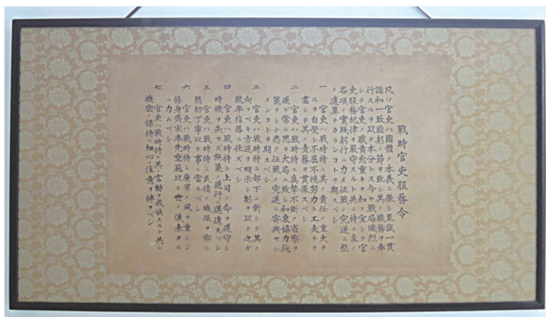
昭和 19 年戦時官吏服務令 (藤沢税務署の署長室に掲げられていた)