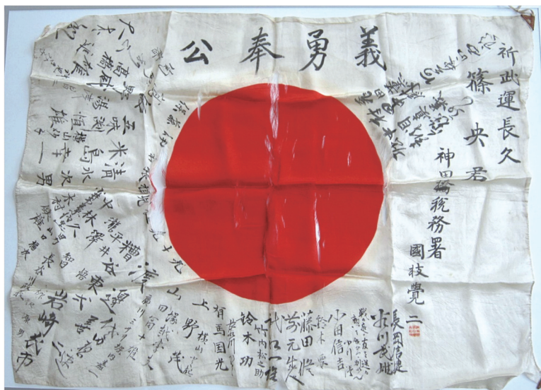
昭和17年 税務署員出征の際の寄せ書き