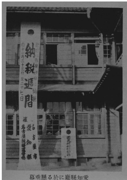
幕垂懸る於に廳縣知愛