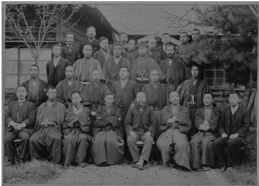
〔明治44年〕岩手県久慈税務署春季町村税務主任会 向かって左側の最後列には制服を着用した税務職員が見える