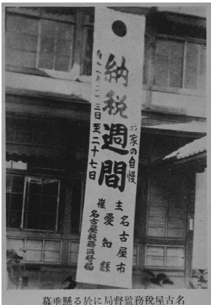
幕垂懸る於に局督監務税屋古名

昭和12年11月 名古屋市・愛知県・名古屋稅務監督局主催の納税週間 (史料 154 参照)