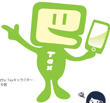
国税庁e-Taxキャラクター： イータ君

国税の場合はe-Tax、地方税の場合はeLTAXを利用して、事前に届出をした預貯金口座からの振替により、簡単な操作で税金を納付することができる便利な電子納税の手段です。