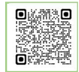
一般取引資料せん 作成フォーマット

一般取引資料せんデータをe-Taxにより送信するためには、e-Taxソフトのダウンロード( https://www.e-tax.nta.go.jp/download/e-taxSoftDownload.htm )が必要になります。 (対応している市販のソフトウェアをご利用の場合を除きます。)