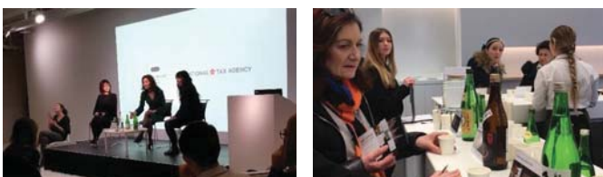
（消費者向けセミナーの様子）