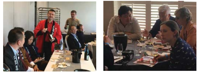
（ワークショップの様子）

さらに、試飲された日本酒の酒蔵から酒類の特徴等の説明が行われ、参加者から多くの質問が挙がるなど、盛況となった。また、「自分の店でも日本酒のペアリングを紹介していきたい」などの意見が聞かれた。