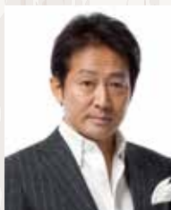
パネリスト 辰巳 琢郎 俳優 「日本のワインを愛する会」会長