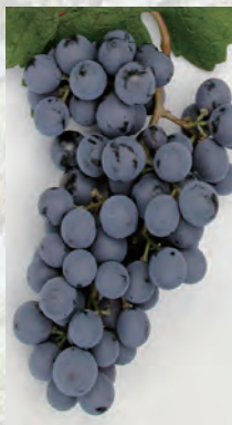
マスカット・ ベリーA