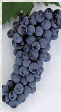
カベルネ・ ソーヴィニヨン