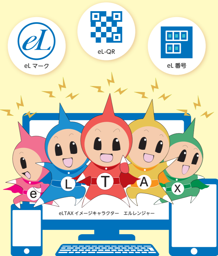
eLAX イメージキャラクター エルレンジャー