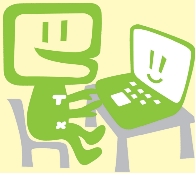
国税庁 e-Tax キャラクター イータ君