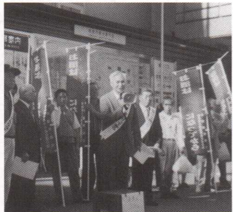
奈良県で行われた未成年者飲酒防止街頭キャンペーンの様相

また、毎年4月が「未成年者飲酒防止強調月間」であることから、関係機関とともに作成したポスターを全組合員に配布し、店舗のよく見えるところに掲示するようお願いしております。