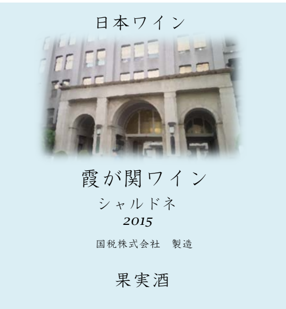
【ワインの産地名を表示する場合】