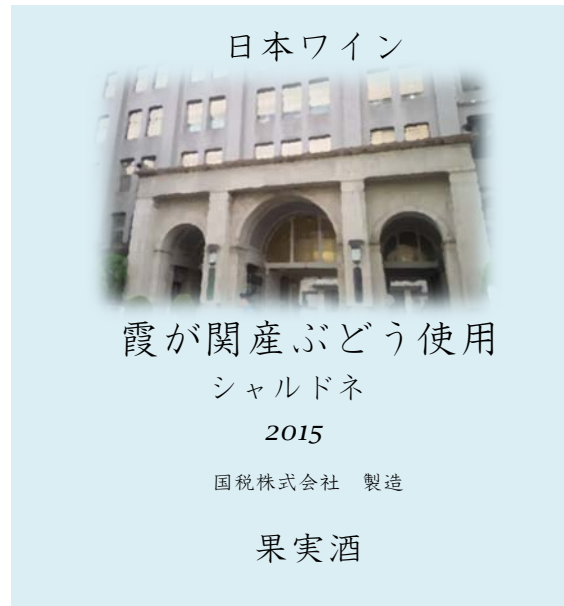
【ぶどうの収穫地名を表示する場合】