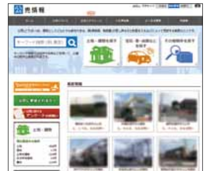
(国税庁ホームページ「公売情報」)