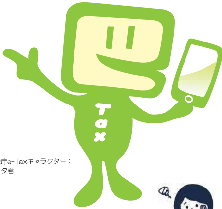
国税庁e-Taxキャラクター： イータ君

国税の場合はe-Tax、地方税の場合はeLTAXを利用して、事前に届出をした預貯金口座からの振替により、簡単な操作で税金を納付することができる便利な電子納税の手段です。